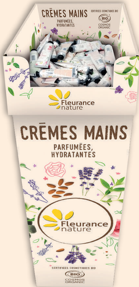
Présentoir sur pied Crèmes mains I 25 x L30 x H104 cm