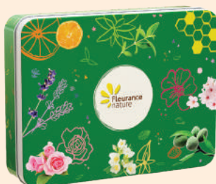
COFFRET MAINS BEIGE INSTANT DOUCEUR (boite métal)