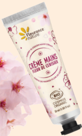
FLEUR DE CERISE