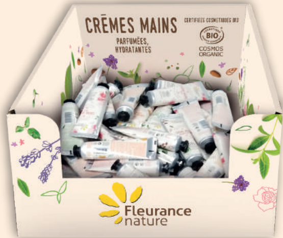
Vasque Crèmes mains I 25 x L30 x H14 cm