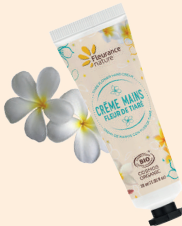
FLEUR DE TIARE